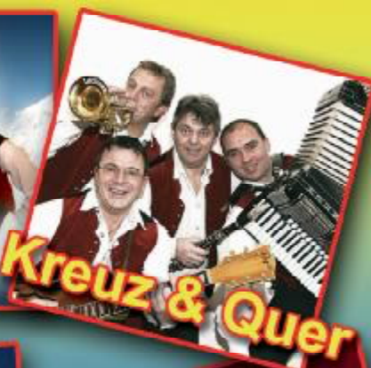
Kreuz & Quer